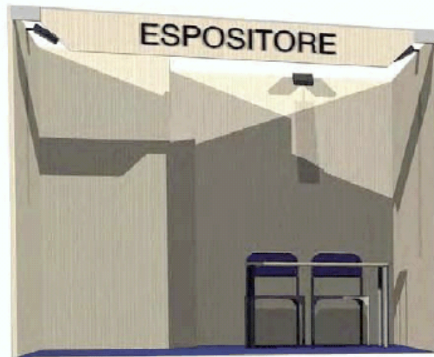
1 LATO APERTO